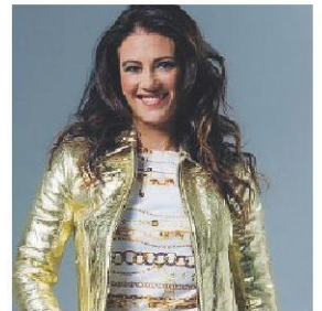
è l'atleta paralimpica conduttrice televisiva Giusy Versace

La proprietà intellettuale è riconducibile alla fonte specificata in testa alla pagina. Il ritaglio stampa è da intendersi per uso privato