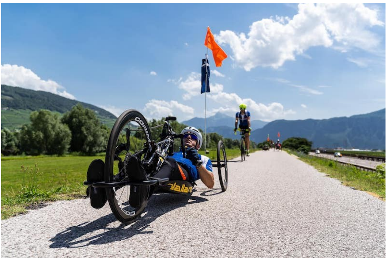
La prima tappa di Obiettivo Tricolore: Cortina -Conegliano