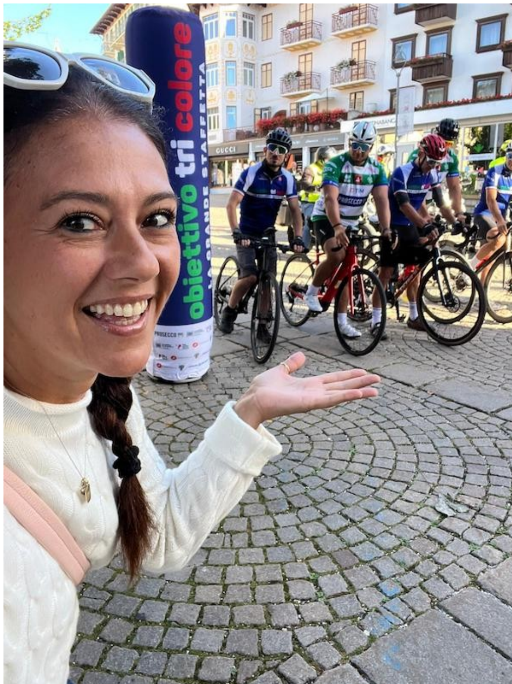
Giusy Versace alla partenza di Obiettivo Tricolore 2023 da Cortina d'Ampezzo